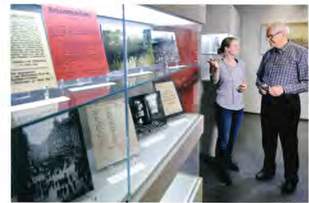
Beratung im Stadtarchiv

Historisches Zentrum Duisburg Anfahrt ÖPNV: Ab Duisburg Hbf mit der U-Bahn Linie 901 Richtung Marxloh/Ruhrort bis Haltestelle „Rathaus Duisburg“, von dort ca. 3 Minuten Fußweg Parkplätze am Rathaus oder im „Parkhaus City“ Unterstraße 19