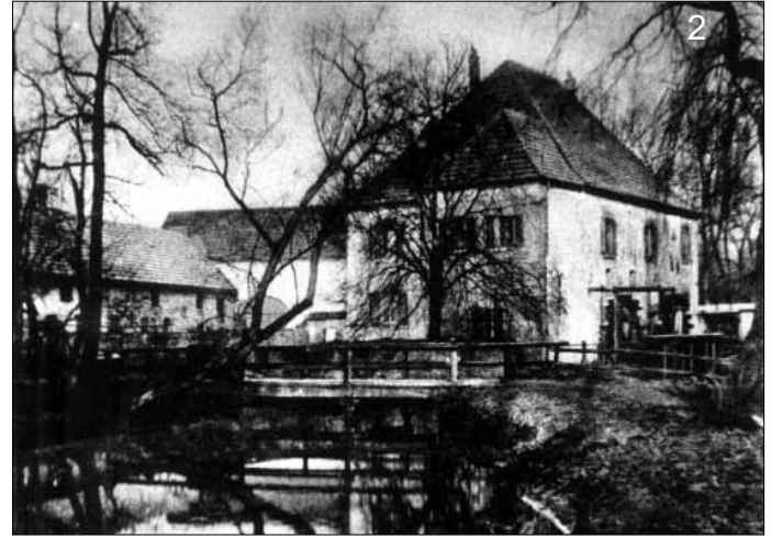
1) Die Aufnahme von 1910 dokumentiert das intakte Ständerwehr und die beiden großen Wasserräder der Zievericher Mühle. 2) Das Foto von 1932 zeigt die Brücke über den Mühlengraben, die Mühle und einen Teil der Hofgebäude. 3) Die Ansicht von 2005 lässt erkennen, dass die Strebenböcke angefault und die Schütze undicht sind. 4) Nach mehrwöchiger Bauzeit wurde die rekonstruierte Wehranlage Anfang Oktober 2012 erstmals geflutet. Die Freiarche erfüllt mit dem Fisch-Bypass an der Schleuse des von der Erft abgehenden Mühlengrabens die EG-WRRL.